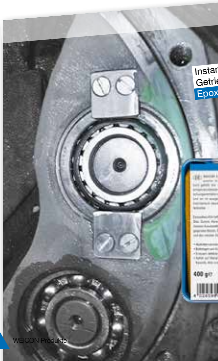
Instandsetzung eines Getriebegehäuses Epoxydharz-Kitt

2-KOMPONENTEN KLEB- UND DICHTSTOFFE EPOXYDHAZ-SYSTEME